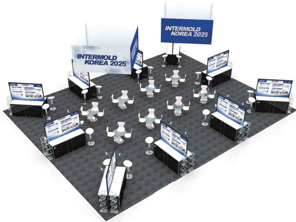
<소성가공·성형제품 특별관 모형도(안)>